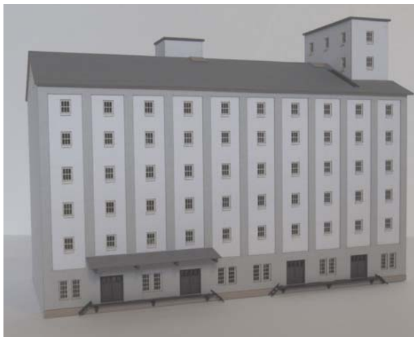
Abb. Spur Z