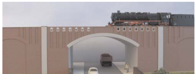
Abb. Spur H0

Bestell-Nr. N201 (lieferbar vsl. ab Herbst 2018) Preis 43,- EUR