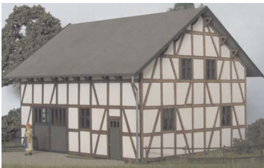
Abb. Spur H0

Bestell-Nr. N501 (lieferbar vsl. ab Herbst 2018) Preis 22,- EUR