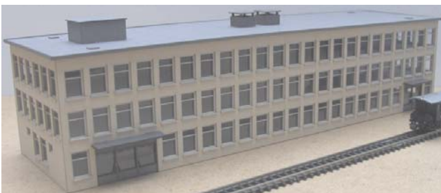
Abb. Spur Z

Bestell-Nr. N801 (lieferbar vsl. ab Herbst 2018) Preis 52,- EUR