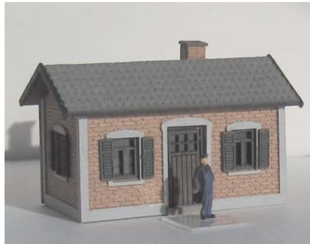
Abb. Spur Z

Bestell-Nr. N1601 (lieferbar vsl. ab Frühjahr 2018) Preis 13,- EUR