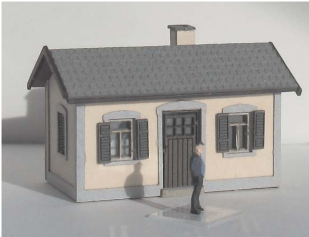
Abb. Spur Z

Bestell-Nr. N1501 (lieferbar vsl. ab Frühjahr 2018) Preis 12,- EUR