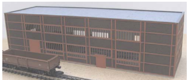
Abb. Spur Z