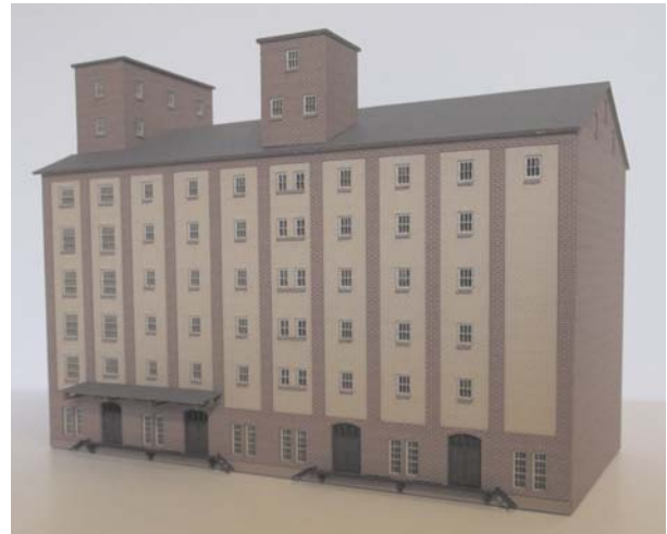
Abb. Spur Z