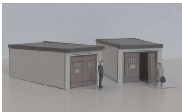
Abb. Spur Z

Bestell-Nr. N1901 (lieferbar vsl. ab Sommer 2018) Preis 14,- EUR